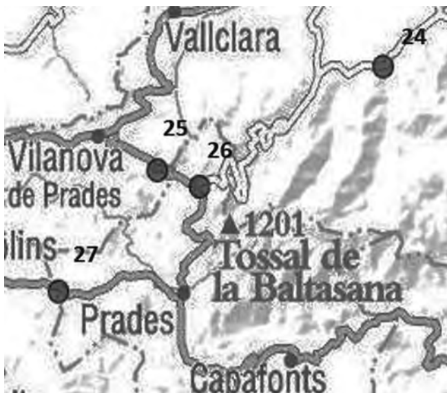
Figura 4. Detall 3 de localitats prospectades a les Muntanyes de Prades (Modificat de http://www.icgc.cat/ )