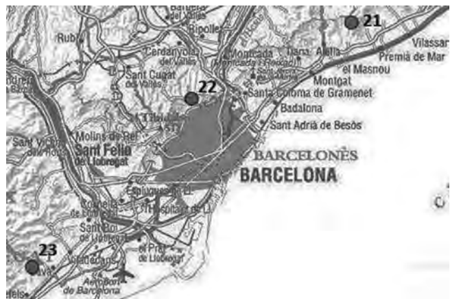
Figura 3. Detall 2 de localitats prospectades al centre del Principat (Modificat de http://www.icgc.cat/ ).