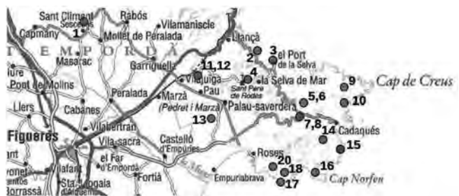
Figura 2. Detall 1 de localitats prospectades al nord del Principat.